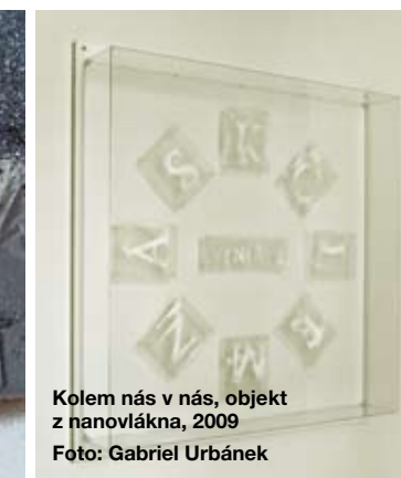
Kolem nás v nás, objekt z nanovláknna, 2009

Her expression evokes a rather fragile impression which is especially striking in the large-dimensional compositions of translucent paper. She first printed on it and later solely employed its structure. She thus slowly and naturally drew herself closer to creating installations in which she worked which translucent papers and later with light. She used fluorescent tubes, situating them into precisely selected environment, while some objects counted on the reaction and participation of viewers. Jůzová departs from her personal experience and is interested in forces that rule the nature; she turns to the possibilities of technology which were originally employed in totally different fields. In 2007 Jůzová presented the Czech Republic at the Venetian Biennial by her project entitled Collection – Series, i.e. a project in which she approached the space of the Czech pavilion as a luxury shop, offering casts of her own body as “products” in the showcases. The artist also participated at many other exhibitions abroad and received many awards. Her works are part of numerous art collections.