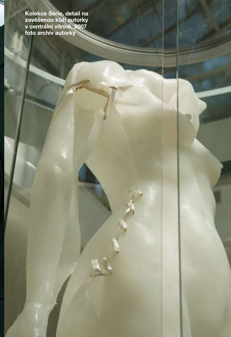
Kolekce Série, detail na zavěšenou kůži autorky v centrální vitríně, 2007